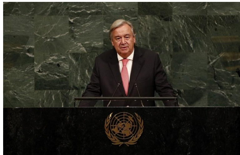
Антониу Гутерриш, генеральный секретарь Организации Объединенных наций